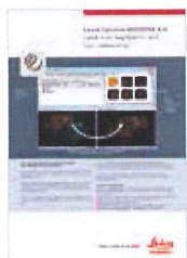
Leica Cyclone REGISTER