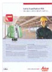
Leica ScanStation P16