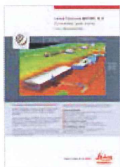
Leica Cyclone MODEL