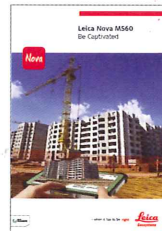
Leica Nova MS60